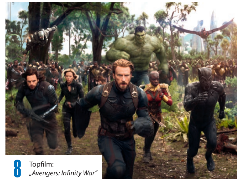
8 Topfilm: „Avengers: Infinity War“