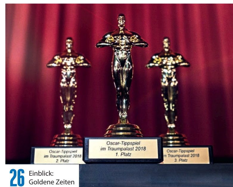
26 Einblick: Goldene Zeiten