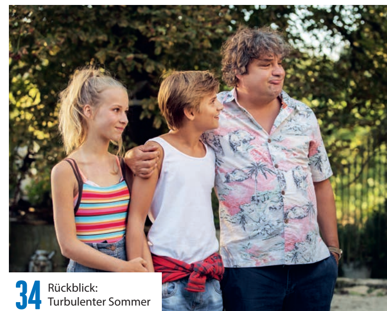
34 Rückblick: Turbulenter Sommer